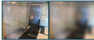
フォーカスチェンジ